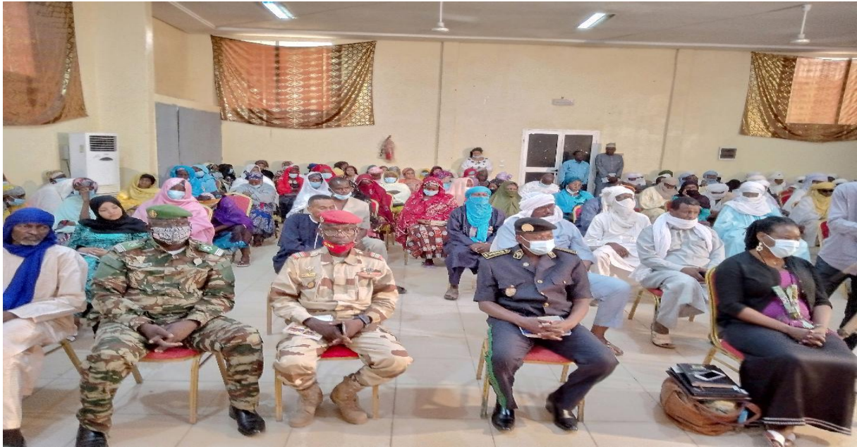
Une vue des participants à la cérémonie de vulgarisation du Guide à Agadez

et à renforcer l'exercice individuel de la citoyenneté, à améliorer le service public entretenant des rapports sains et loyaux avec les usagers.