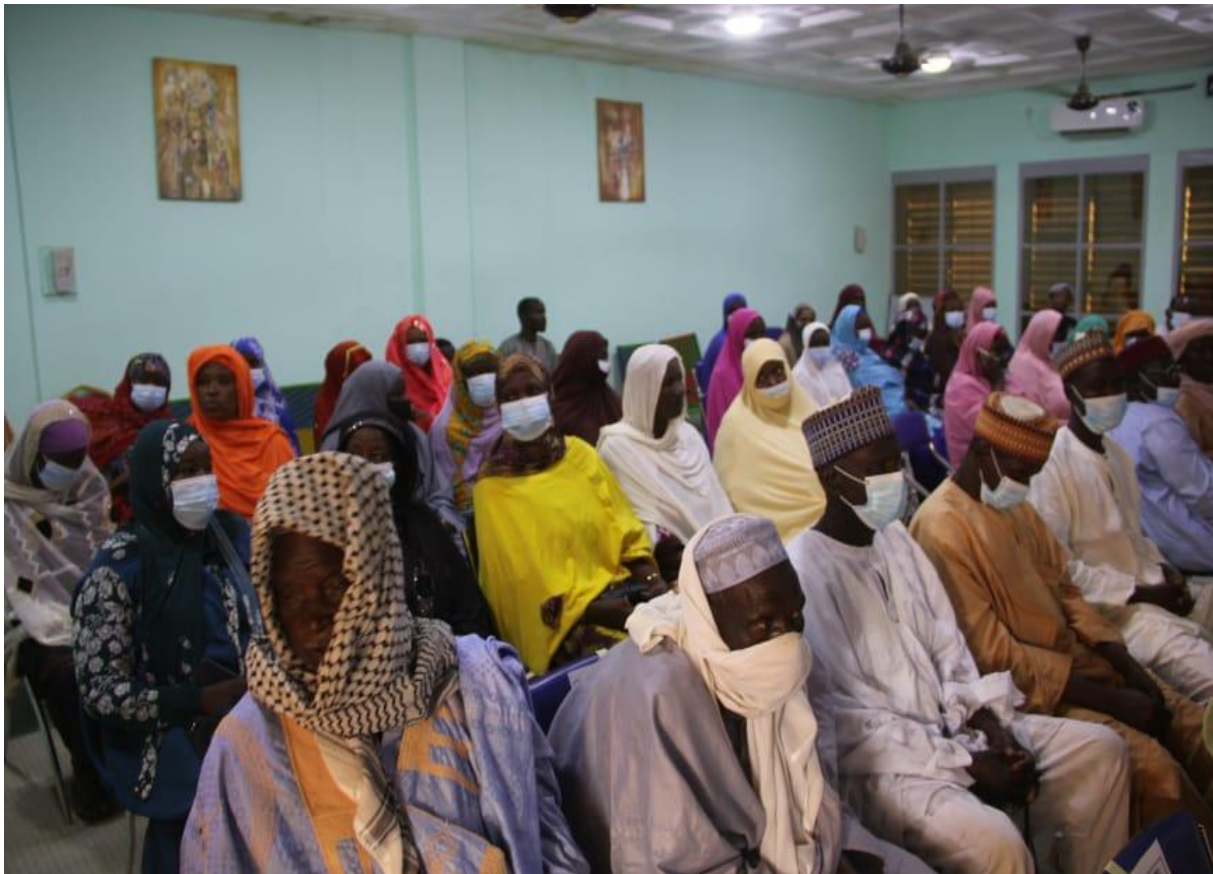
Participants cérémonie Diffa

à son tour, Le représentant du bureau de Counterpart de Diffa a pour sa part rappelé les différentes réalisations faites dans la région par sa structure dont la création d'un cadre d'échanges et de dialogue multipartites et multi acteurs entre les décideurs et les acteurs communautaires et c'est dans le même esprit que s'inscrit l'élaboration et la vulgarisation du guide du citoyen avec la volonté et l'intérêt affichés par le Médiateur de la République.